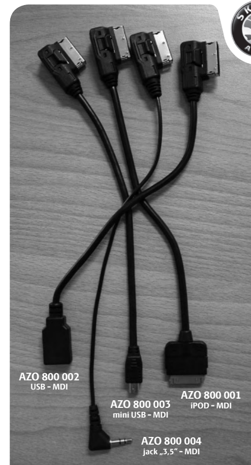
AZO 800 002 USB - MDI

Atenționare. Cablul cu terminația Jack „3,5“ nu permite alegerea (selectarea) pieselor din meniul radioului auto sau a navigației. Celelalte cabluri permit această selectare.